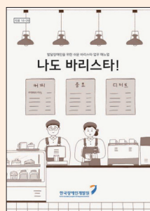
발달장애인을 위한 쉬운 바리스타 업무 매뉴얼

** 동영상: 이동보조기기 분해세척 및 소독, 건강검진센터 보조, 택배물품 상하차 보조, 기부물품 관리, 룸메이드, 주차단속 보조, 문서파기 등