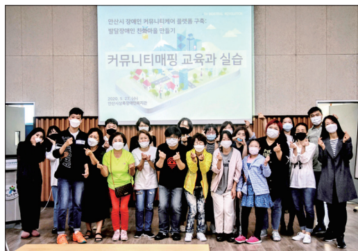
▲ 발달장애인 친화마을, 우리에게 맡겨요!

장애인 고용·사진 메뉴판·보완대체의사소통·경사로 유무 등)를 등록할 수 있다. 발달장애인과 가족은 평점을 보고 관람할 영화나 식당을 정하는 것처럼, 이용할 상점을 정할 때 앱에 표시된 정보를 참고할 수 있다.