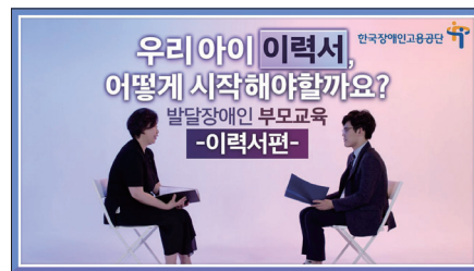
발달장애인 부모교육(이력서 편)