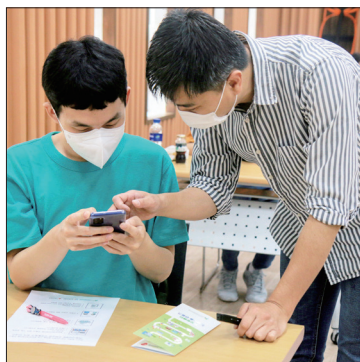
▲ 매핑 활동가가 되기 위한 준비!